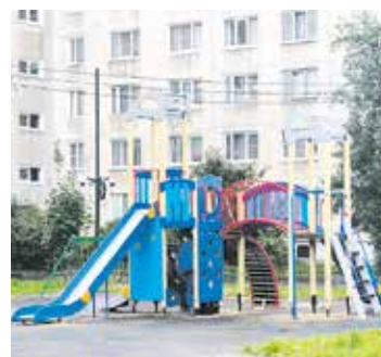
Ул. Олеко Дундича, д. 8

— Демонтаж детских площадок стараемся проводить в конце года, когда детские площадки менее востребованы. В нашем округе было демонтировано несколько таких площадок. Это было связано с окончанием срока эксплуатации оборудования, которое по закону, независимо от его состояния, даже если оно выглядит как новое, обязаны демонтировать. И для нашего муниципального округа подошли сроки для замены оборудования площадок, поэтому мы будем их заново устанавливать, а не восстанавливать. На каких-то площадках заменяются отдельные элементы. Мы надеемся, что люди отнесутся к этому с пониманием. В этом году мы подавали заявку — уже на следующий год — и нам ее одобрили.