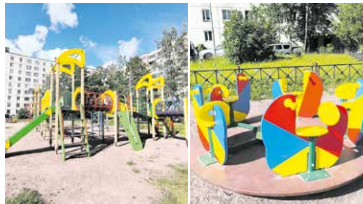
Будапештская ул., д. 110/23

По адресу: Купчинская ул., д. 29, к. 1, настоящей изюминкой новой игровой площадки стала красочная дорожка-змейка. Были также установлены детский игровой комплекс, песочница, рукоход, новые качели «Гнездо»,