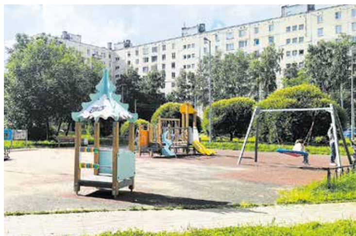
Будапештская ул., д. 104, к. 1

Чуть дальше по Будапештской улице, д. 110/23, на