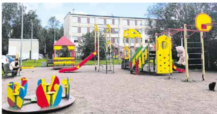
Будапештская ул., д. 98, к. 3