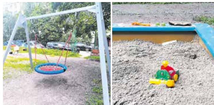
Загребский бул., д. 35/28

подвес качелей с резиновым сиденьем, качалка-балансир. Четыре новых садово-парковых дивана укомплектованы урнами со вставками.