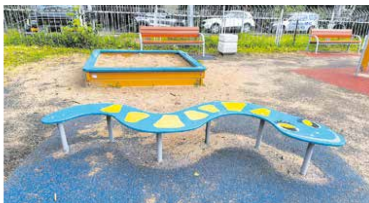
Купчинская ул., д. 29, к. 1