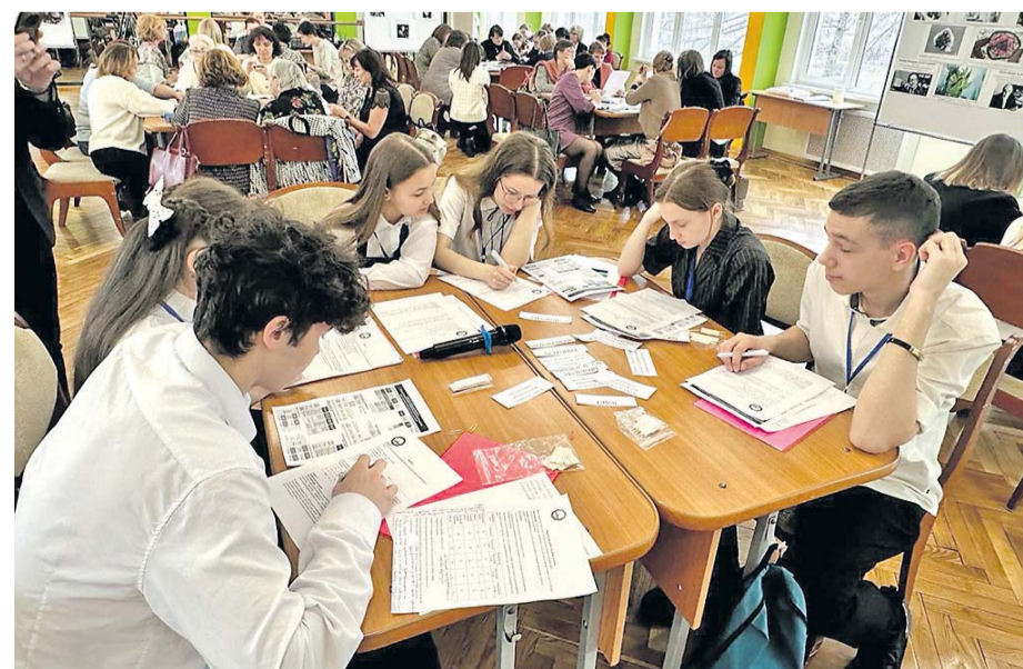
«День построения целостного знания — 2024»