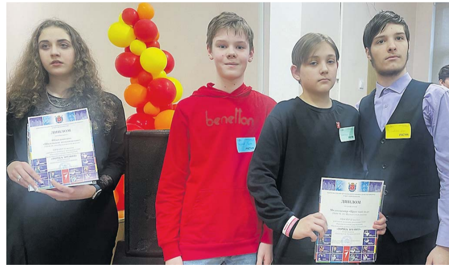
Журналисты школьного медиацентра