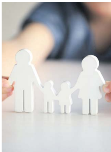
Опека: забота о детях превыше всего