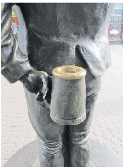
Выдающийся нос солдата Швейка