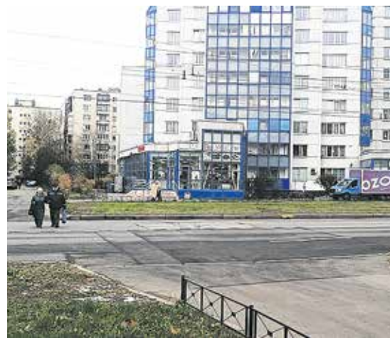
Здесь нужен пешеходный переход

Он ответил: «Вопрос жителями поднят правильный и актуальный, действительно пешеходный переход