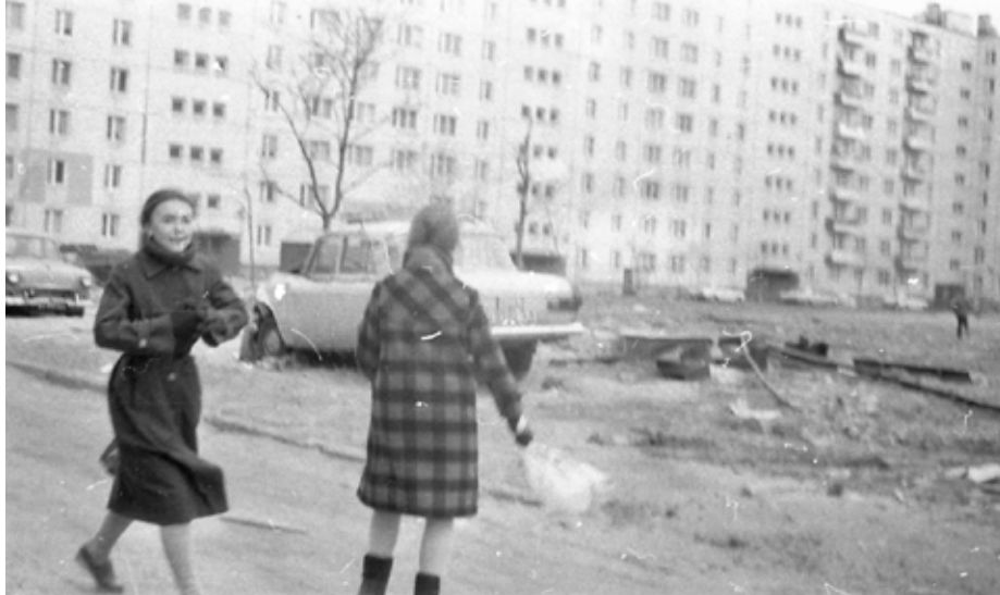
Двор дома 110 по Будапештской улице. 1986 год

О собрании нужно оповестить собственников за 10 дней до намеченной даты.