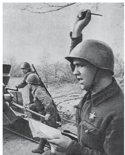
Хроники нашей Победы стр. 7