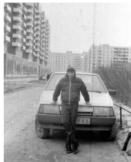
Во дворе дома № 110 по Будапештской улице. 1987 год