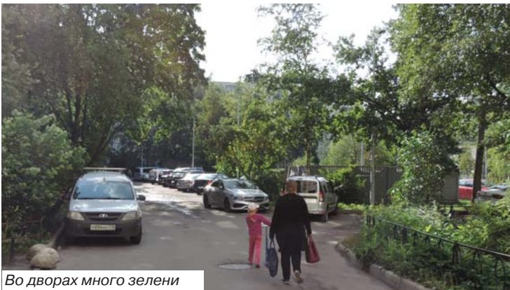
Во дворах много зелени