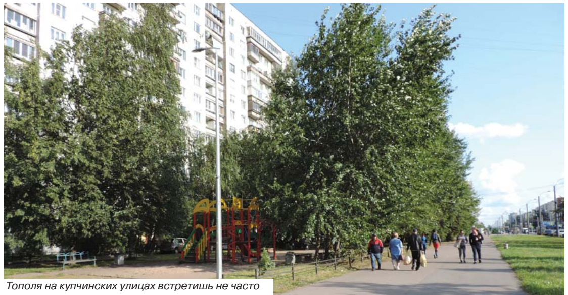
Тополя на купчинских улицах встретишь не часто

Но, как оказалось, есть и минусы. Тополя ведь деревья не маленькие, не успеешь оглянуться, а тополиная аллея