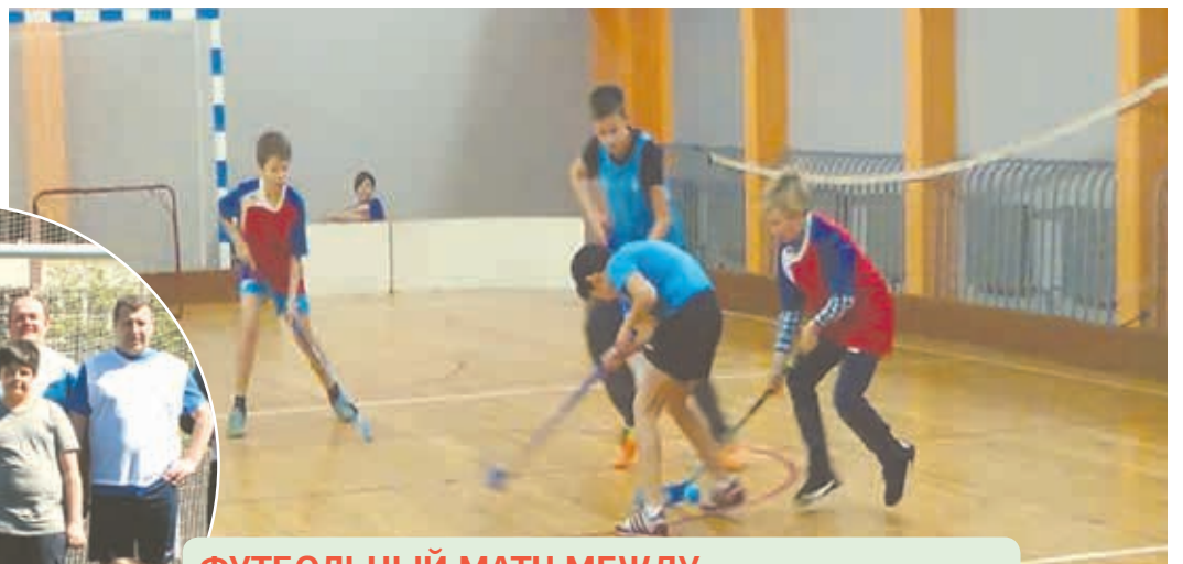
ФУТБОЛЬНЫЙ МАТЧ МЕЖДУ ШКОЛЬНИКАМИ И СОТРУДНИКАМИ ПОЛИЦИИ