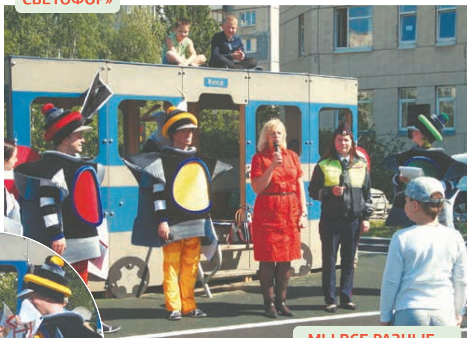
«МЫ ВСЕ РАЗНЫЕ, НО МЫ ВСЕ РАВНЫ»

В рамках программы «Участие в профилактике терроризма и экстремизма» в СМИ регулярно размещаются информационные материалы по тематике терроризма, экстремизма и правонарушений, были организованы две уличные акции, посвященные памяти жертв терроризма, состоялся просмотр художественного фильма по анти-террористической тематике.