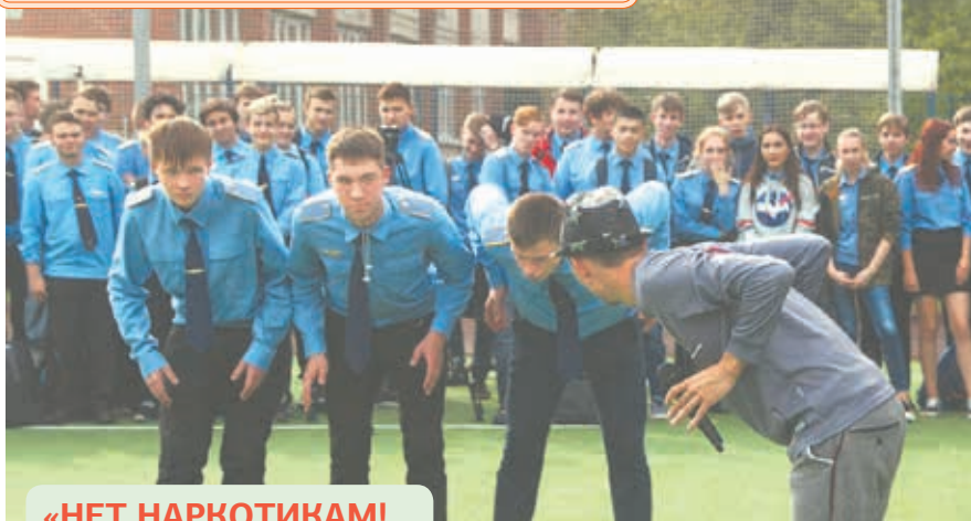
«НЕТ НАРКОТИКАМ! Я ВЫБИРАЮ ЖИЗНЬ»