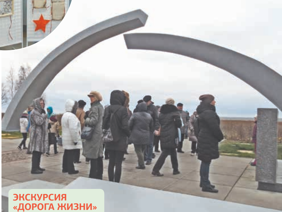
ЭКСКУРСИЯ «ДОРОГА ЖИЗНИ»