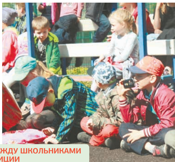
ФУТБОЛЬНЫЙ МАТЧ МЕЖДУ ШКОЛЬНИКАМИ И СОТРУДНИКАМИ ПОЛИЦИИ