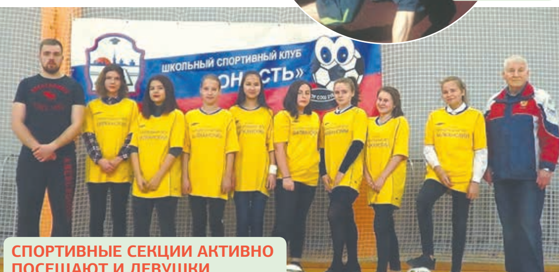
СПОРТИВНЫЕ СЕКЦИИ АКТИВНО ПОСЕЩАЮТ И ДЕВУШКИ