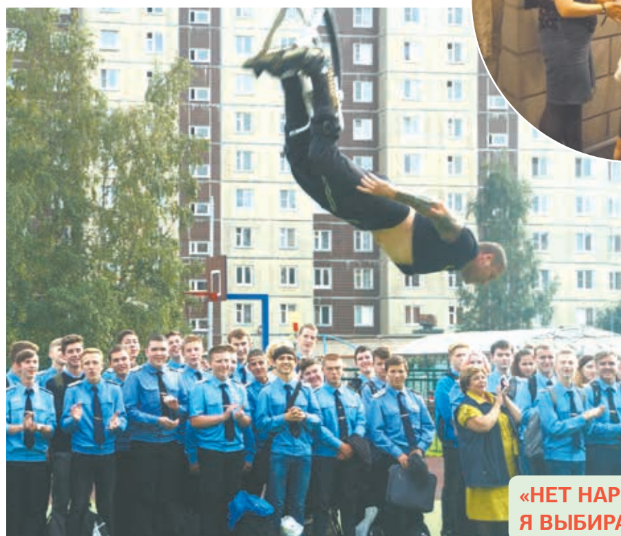
«НЕТ НАРКОТИКАМ! Я ВЫБИРАЮ ЖИЗНЬ»