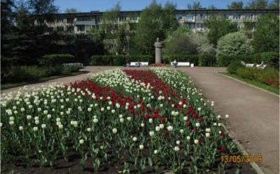
Сквер на проспекте Славы, 28