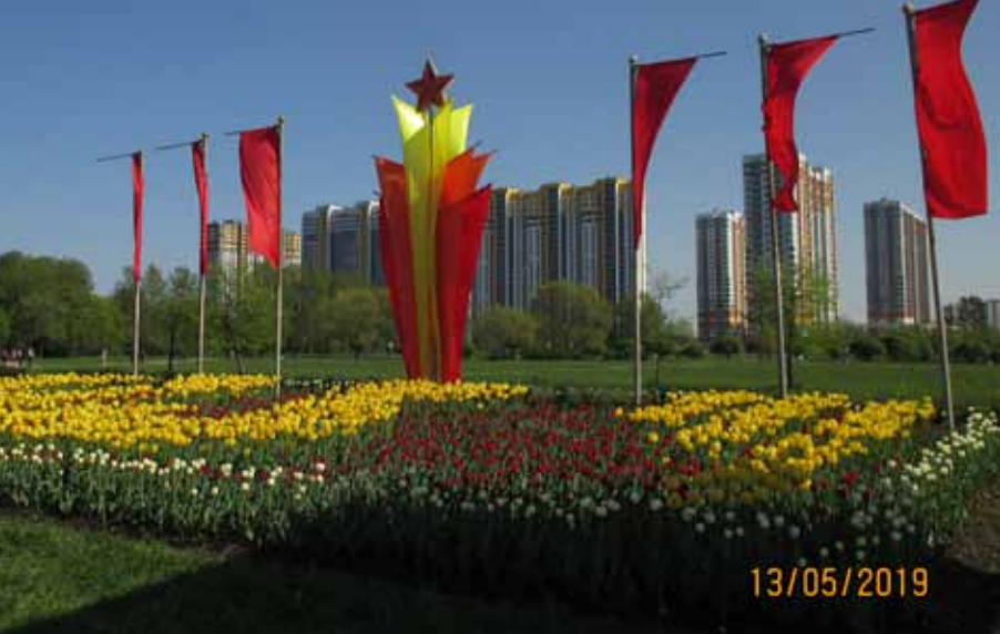
Проспект Славы на пересечении с Пражской улицей