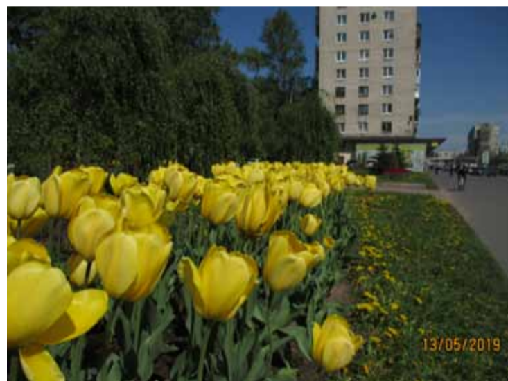
Сквер на проспекте Славы, 10