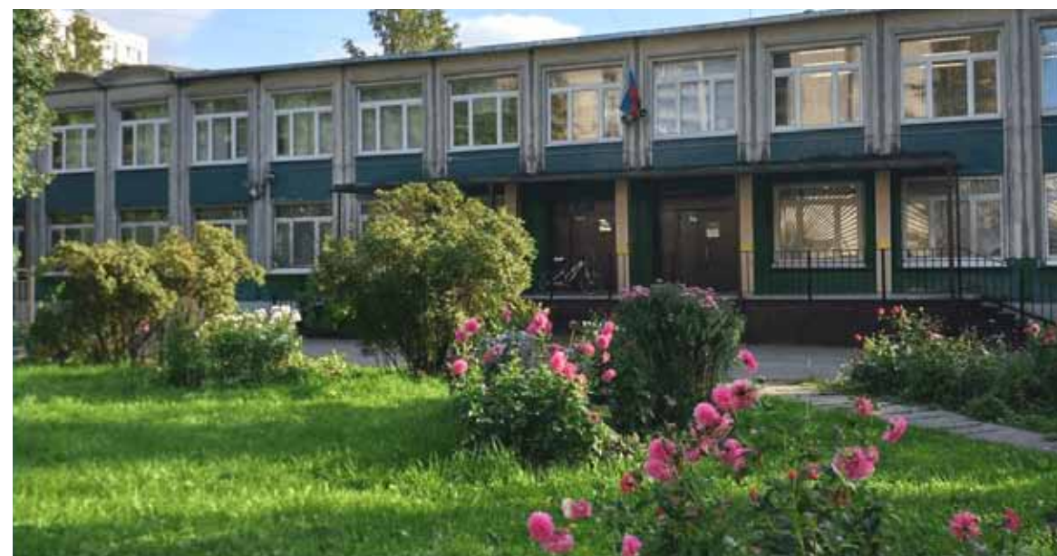
Школа № 312 с углубленным изучением французского языка Фрунзенского района