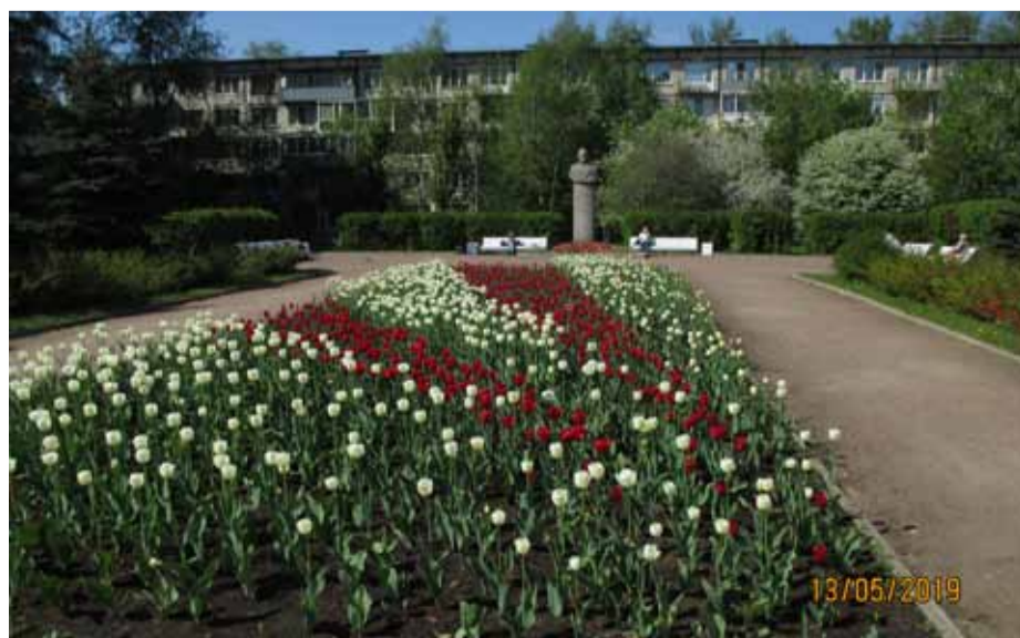
Сквер на проспекте Славы, 28