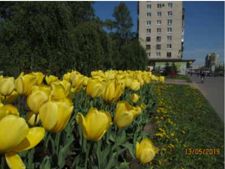
Сквер на проспекте Славы, 10