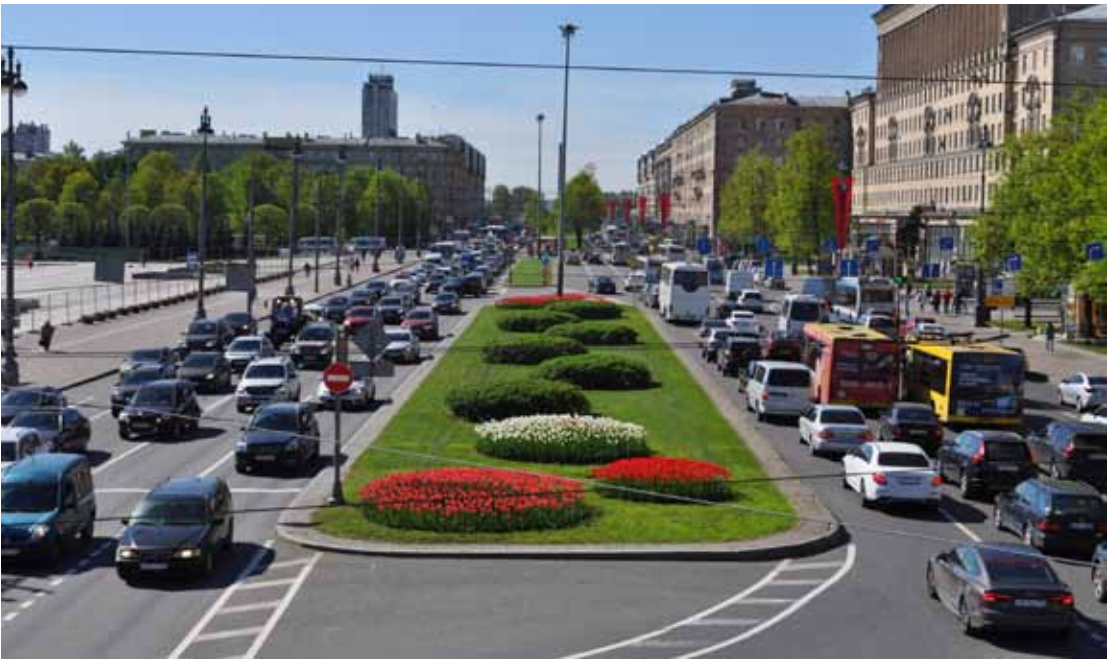
На Московском проспекте