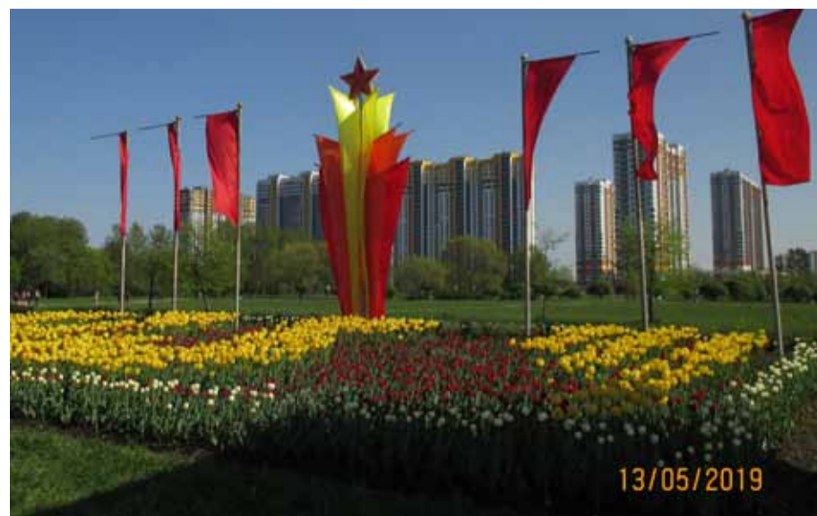
Проспект Славы на пересечении с Пражской улицей