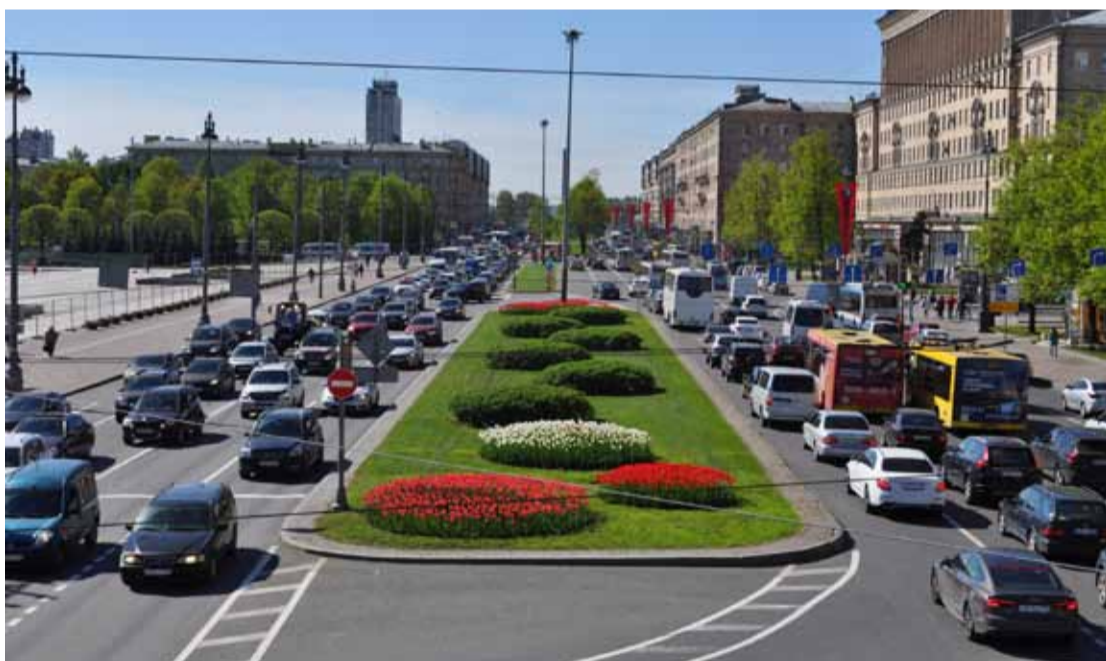
На Московском проспекте