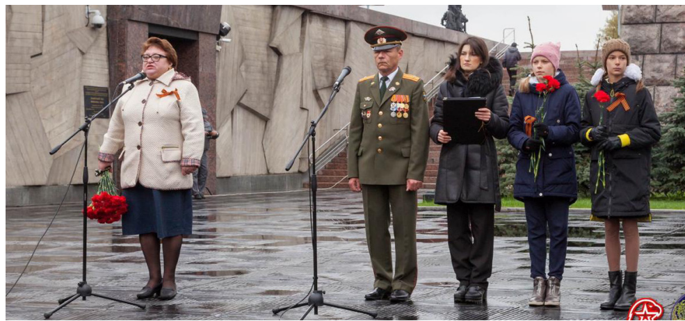
Торжественная присяга юнармейца — 2019

— Люблю погулять с дочкой и внучкой по городу, зайти в Летний сад. Или поеду на любимую дачу, где ждут меня мои цветы и новый (пока еще пустой) парник.