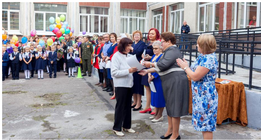
1 сентября в школе № 314