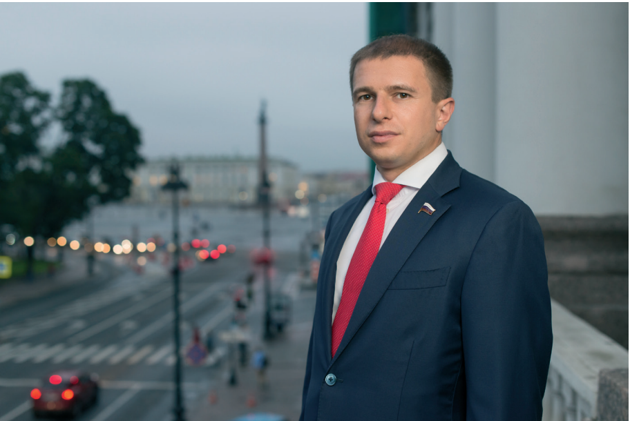
В поздравлении депутата Государственной Думы ФС РФ, Заместителя