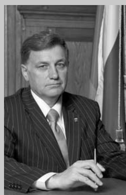
Председатель Законодательного Собрания Санкт-Петербурга Секретарь Санкт-Петербургского регионального отделения партии «Единая Россия»