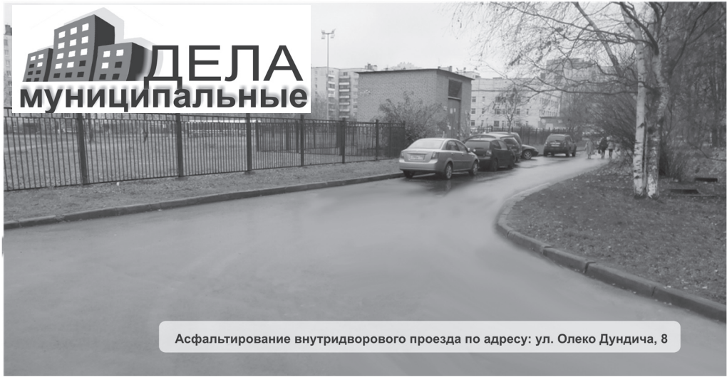
Асфальтирование внутридворового проезда по адресу: ул. Олеко Дундича, 8

представители общественных организаций округа, помогает эффективнее планировать культурные мероприятия, а также совершенствовать работу местной администрации, в том числе оценивая ее деятельность. Для консультаций по интересующим жителей вопросам, на заседания Координационного Совета приглашаются специалисты различных ведомств и государственных структур, что является важной составляющей работы по взаимоотношениям с общественностью.